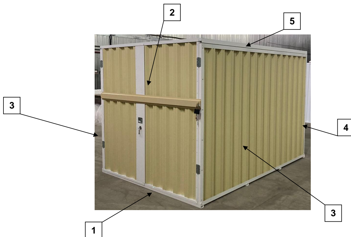
Рис.1 Внешний вид контейнера

* Внешний вид может отличаться в зависимости от модификации.